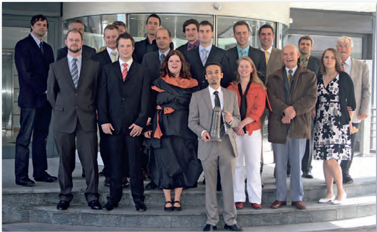
Die neuen Meister mit der Prüfungskommission im April 2011